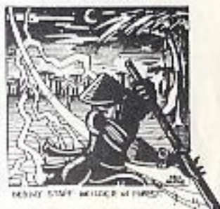
DEADLY STAFF WELTER IN FOREST